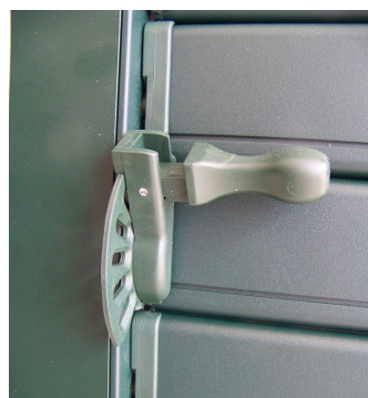
lamelle orientabili con sistema di movimentazione in tinta e cloche in tinta di serie

Maggiore durata: alluminio verniciato contro selle in plastica Cura dei Particolari: il sistema di fissaggio delle lamelle è dello stesso materiale e dello stesso colore di tutta la persiana.